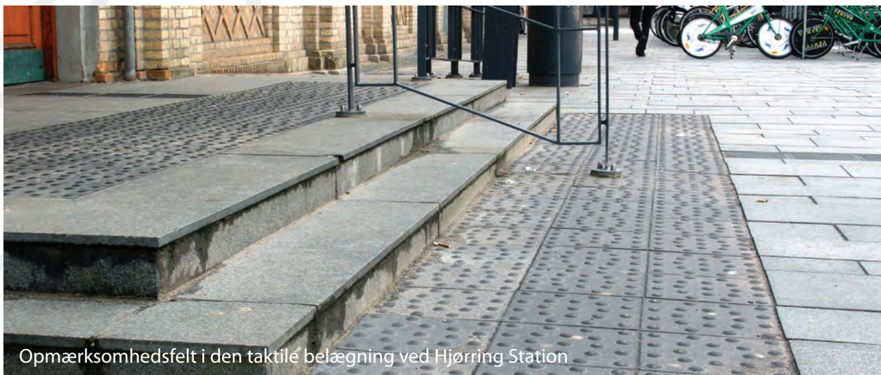
Opmærksomhedsfelt i den taktile belægning ved Hjørring Station