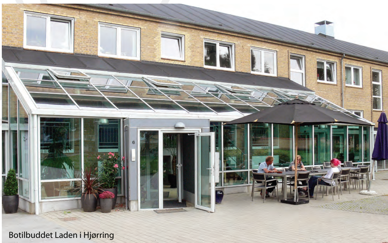
Botilbuddet Laden i Hjørring

“ Et hjem er et sted, hvor man kan lukke og låse sin dør. Et hjem sikrer tryghed. Et hjem er et sted, hvor man kan være privat. Et hjem er indrettet, så man kan fungere med mindst mulig hjælp. Et hjem er et sted, hvor man kan opføre sig "tosset" ”