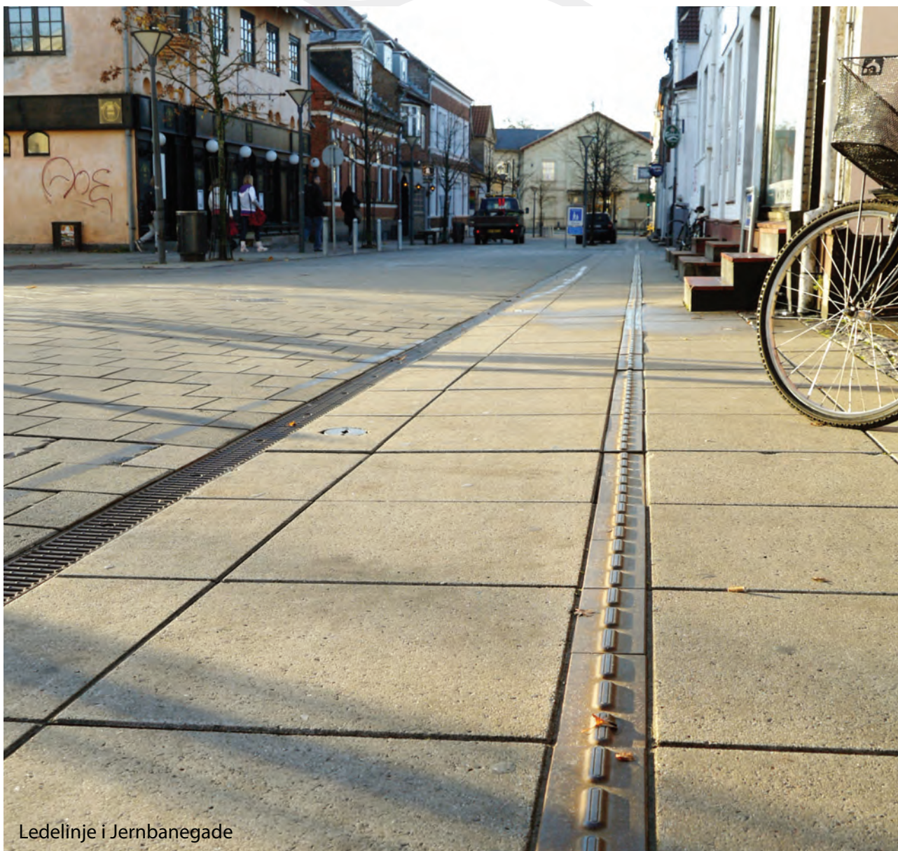
Ledelinje i Jernbanegade

Der nedsættes en følgegruppe sammensat på tværs af serviceområderne. Følgegruppen suppleres med to repræsentanter udpeget af Handicaprådet. Følgegruppen refererer til Direktionen. Følgegruppen evaluerer og følger op på igangsatte initiativer og kommer med forslag til næste års handleplan. Handleplanen skal koordineres med eksisterende planer og strategier for handicaptiltag på de enkelte serviceområder.