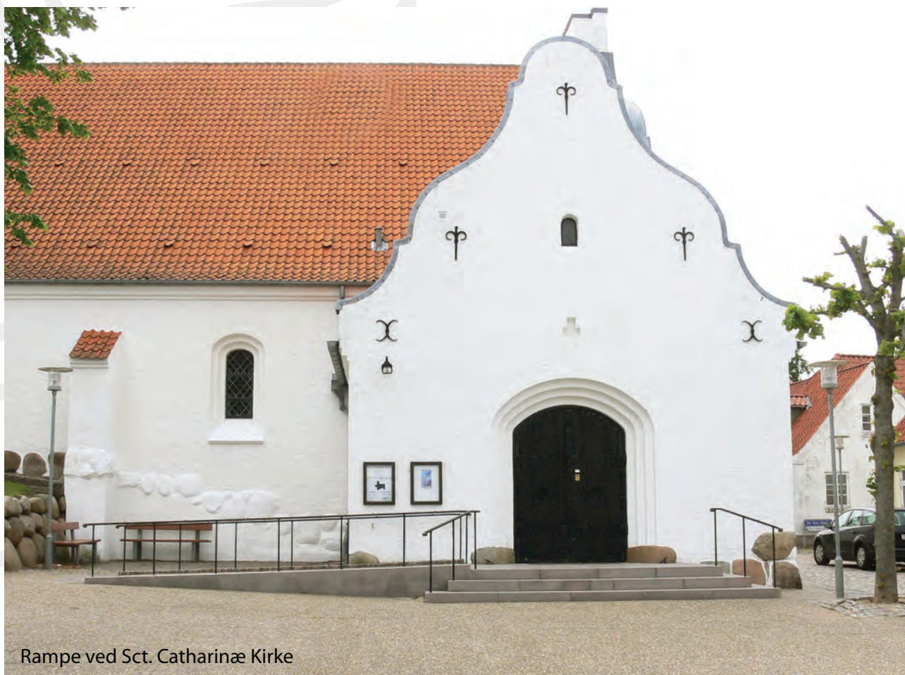
Rampe ved Sct. Catharinæ Kirke