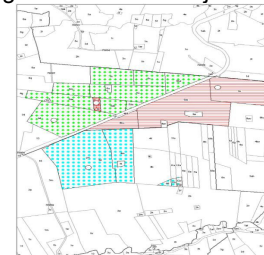
Figur 2. Efter jordfordeling