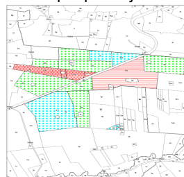
Figur 1. Før jordfordeling

Eksempel på en jordfordeling mellem fire lodsejere: