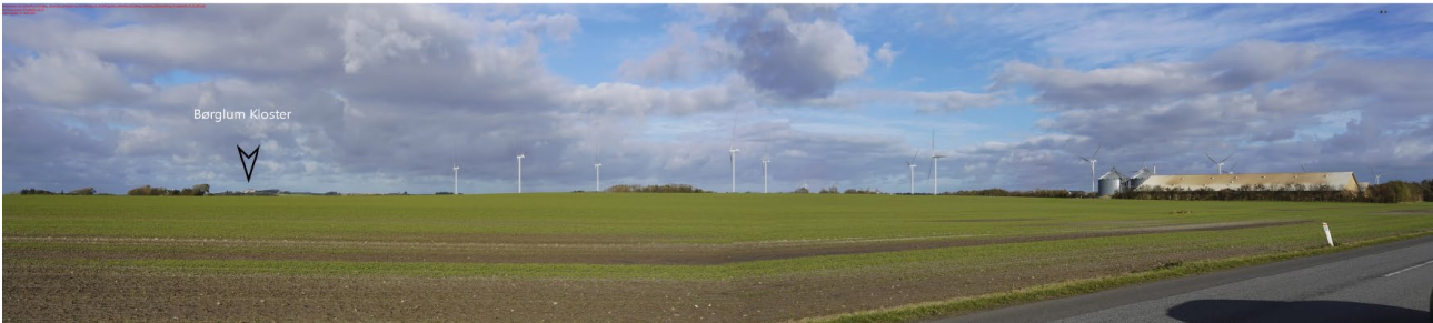
Figur 6: Visualiseringen viser vindmølle-alternativ 1 med 14 møller med en totalhøjde på 150 m set fra Brønderslevvej.