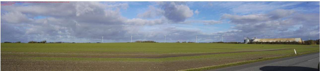
Figur 7: Visualiseringen viser vindmølle-alternativ 2 med 10 møller med en totalhøjde på 150 m set fra Børglum Kloster.