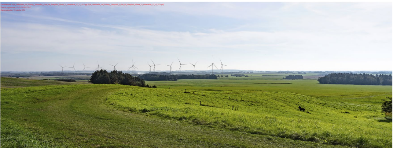
Figur 3: Visualiseringen viser vindmølle-alternativ 1 med 14 møller med en totalhøjde på 150 m set fra Børglum Kloster.