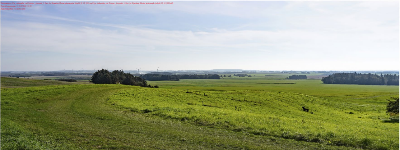
Figur 2: Billedet viser eksisterende forhold set fra Børglum Kloster, hvor eksisterende møller ved Hjortnæs ses i venstre halvdel af billedet.