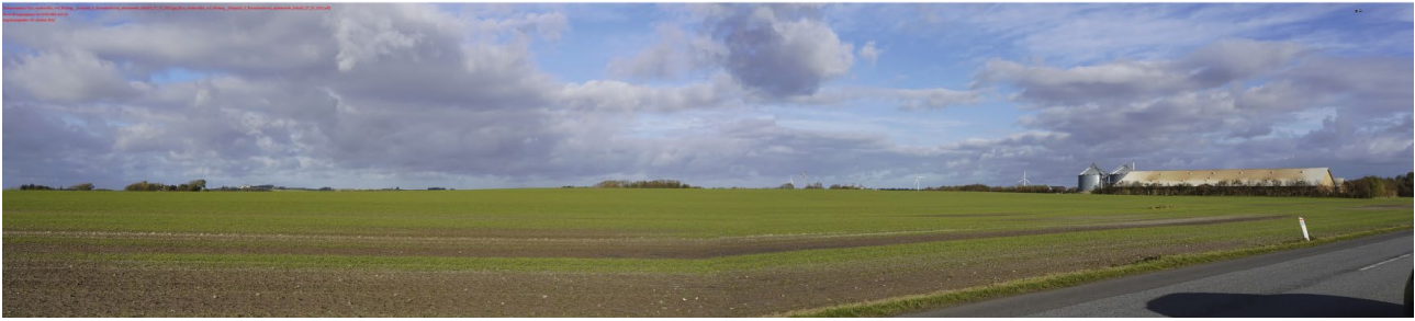
Figur 5: Billedet viser eksisterende forhold set fra Brønderslevvej, hvor Børglum Kloster ses til venstre billedet, mens eksisterende møller ved Hjortnæs ses til højre i billedet.