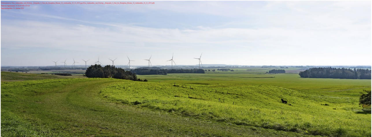
Figur 2: Visualiseringen viser vindmølle-alternativ 2 med 10 møller med en totalhøjde på 150 m set fra Børglum Kloster.