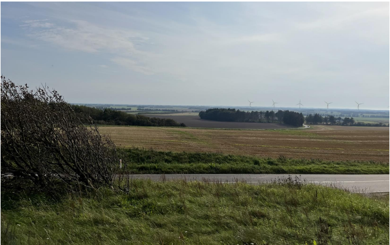
Figur 3: Visualiseringen viser vindmølle-alternativ 1 med 6 møller med en totalhøjde på 150 m set fra Børglum Kloster Mølle, som ligger umiddelbart nordvest for Børglum Kloster. Møllerne ses til højre i billedet, dog kan kun vingen af den sjette mølle anes i kanten af billedets højre side.