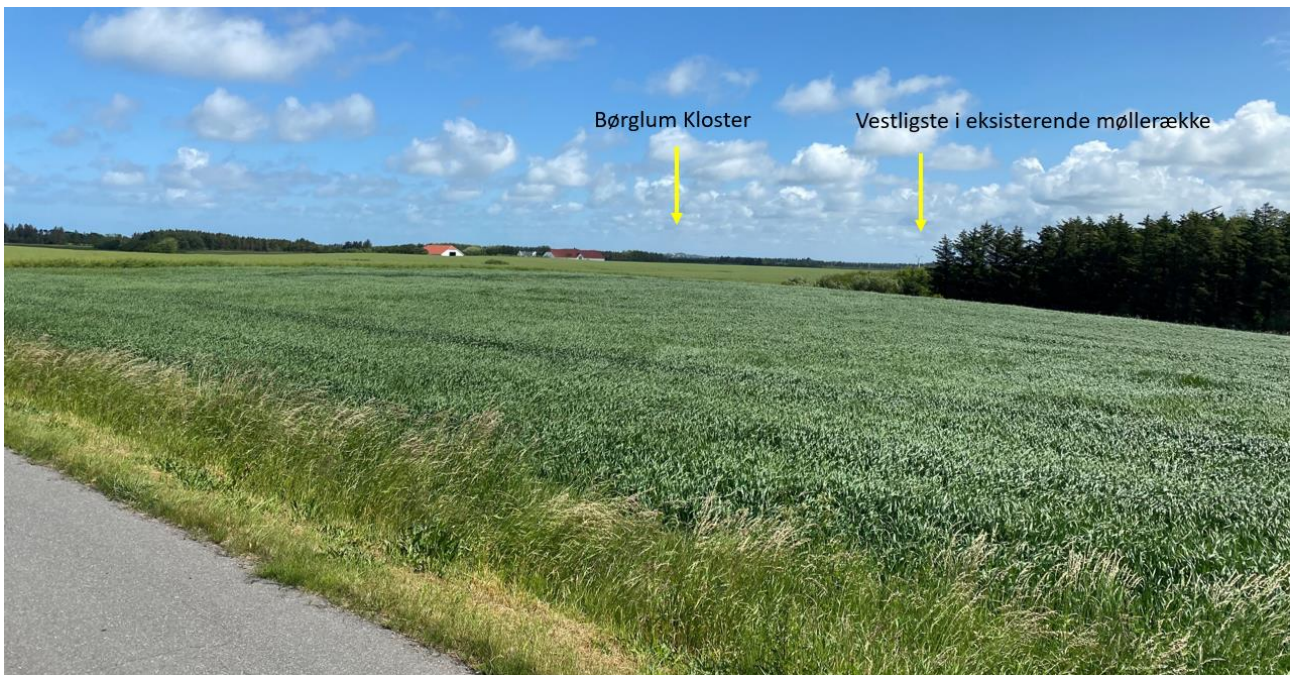
Figur 5: Billedet viser eksisterende forhold set fra Trudslevvej, hvor Børglum Kloster kan ses i midten af billedet og den vestligste af de eksisterende møller syd for kommunegrænsen ses i udkanten af skovbevoksningen i højre side af billedet. Møllerækken i det ansøgte projekt vil blive placeret vest for den viste eksisterende mølle og dermed midt i billedet.