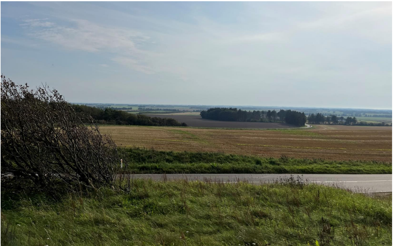
Figur 2: Billedet viser eksisterende forhold set fra Børglum Kloster Mølle, som ligger umiddelbart nordvest for Børglum Kloster.